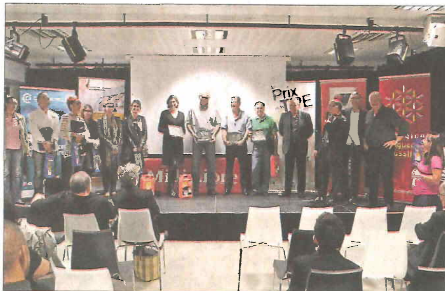
■ Les vainqueurs des prix au milieu des concurrents et du jury.

Le nom des trois lauréats du Pays de Lunel (lire ci-dessous leurs profils) a été dévoilé jeudi; ils rencontreront mercredi 28 novembre au Corum à Montpellier leurs adversaires du cœur de l'Hérault, du grand Montpel-